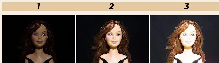
Imagen 3. Iluminación incorrecta (1 y 3) y correcta (2).

poca luz y con una ventana en donde se concentre la claridad del exterior, lo cual desviaría el foco de atención a ese punto. Evitar la contraluz, esto sucede por ejemplo cuando se tiene una ventana por detrás de la persona que saldrá a cuadro, y procurar que la iluminación se concentre en el cuadro principal.