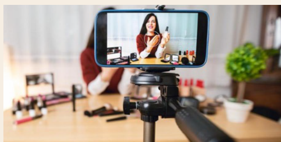
Imagen 2. Encuadre correcto para el testimonio.

Por otro lado, se solicita que los testimonios sean individuales y no grupales.